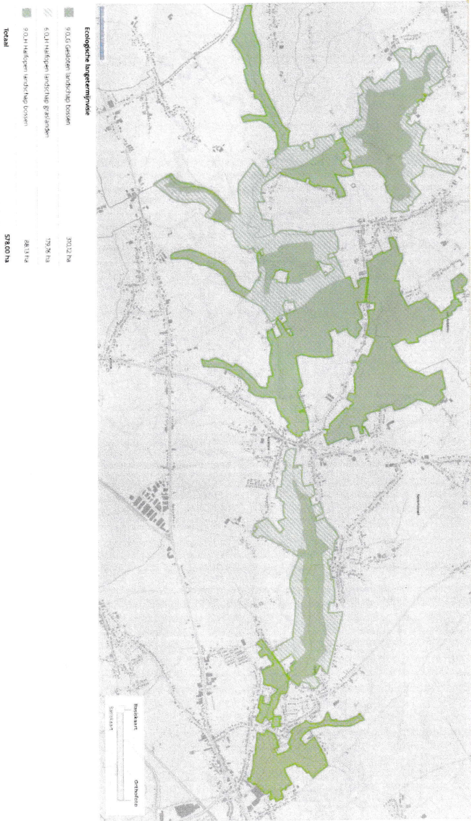
Figuur 3: ecologische langetermijnvisie.

Over de economische langetermijnvisie wordt in het aanvraagdossier gezegd dat deze door de beheerder ondergeschikt wordt geacht aan de ecologische en sociale functie. En dat voor een gebied dat voor 70% in landbouwgebied ligt!